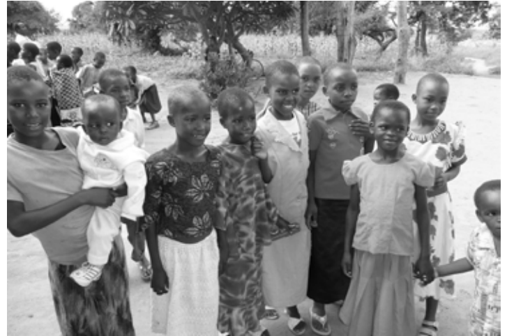
Mädchengruppe in Tansania

Alina Götz | foej@ven-nds.de | Tel.: 0511-391650