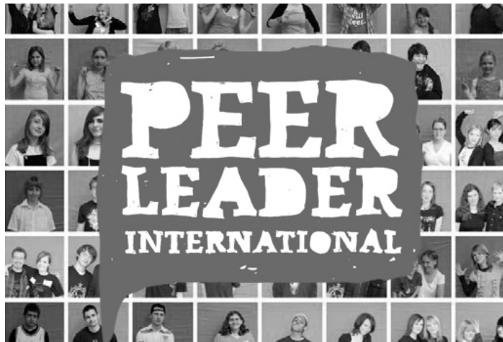
Die „Peer-Leader“- sammeln Stimmen gegen Armut

Ein großes Problem ist zurzeit die Trinkwasserversorgung. Kinder und Frauen legen weite Wege zurück, um aus der Stadt das Wasser in 20 Liter- Kanistern zu holen. Der Preis für Leitungswasser in einem Kanister beträgt 500 TSh (ca. 25 Cent). Die erstellten Regenwassersammelanlagen sind inzwischen bereits leer, und der neu gebaute Brunnen liefert wegen der Absenkung des Grundwassers auch kein Wasser mehr.