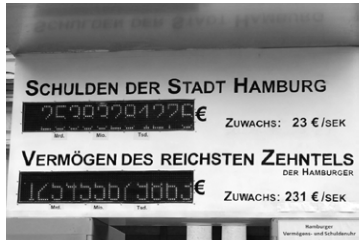
Nackte Zahlen: Die Vermögens- und Schuldenuhr

Die Kürzungspolitik im Hochschulbereich, die in den letzten Wochen von den verantwortlichen Hamburger Politikern und Politikerinnen mal als angeblich „alternativlos“, mal als gar nicht existent dargestellt wurde, steht im Zusammenhang mit der rigiden Sparpolitik, die sich aus der Umsetzung der sogenannten „Schuldenbremse“ zur Konsolidierung der öffentlichen Haushalte ergibt. Dass die Verschuldung der öffentlichen Haushalte jedoch nicht „vom Himmel gefallen“, sondern eine Folge politischer Entscheidungen der letzten Jahrzehnte ist (Abschaffung der Vermögenssteuer 1997, Absenkung der Steuern auf große Vermögen) wird in der Mainstream-Debatte kaum benannt.