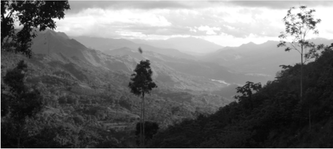
La Cuchilla: Dieses Tal soll geflutet werden