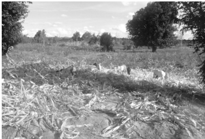
Versorgungskrise in Tansania