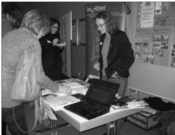
Auf dem Markt der Möglichkeiten wurden viele Bildungsangebote zum globalen Lernen vorgestellt