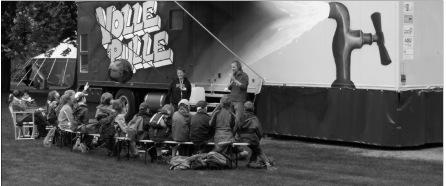
Der Wassertruck „Volle Pulle“ bietet viel Informatives und Unterhaltendes zum Thema „Wasser“