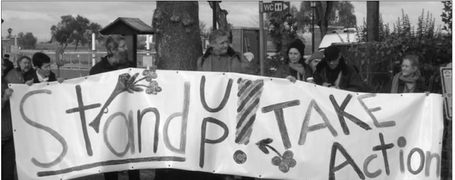
„Steh auf gegen Armut“ forderten die Menschen in Hitzacker

stanz zwischen heutiger Lebenswirklichkeit und einer Gesellschaft, in der jede und jeder selbstbestimmt in Würde, solidarischem Miteinander und intakter Natur leben können, ist gewachsen. Vor allem die Lage der global Ärmsten ist noch dramatischer geworden unter dem zusätzlichen Druck von Finanz- und Wirtschaftskrisen, verquickt mit Ernährungs-, Umwelt- und Energiekrisen.