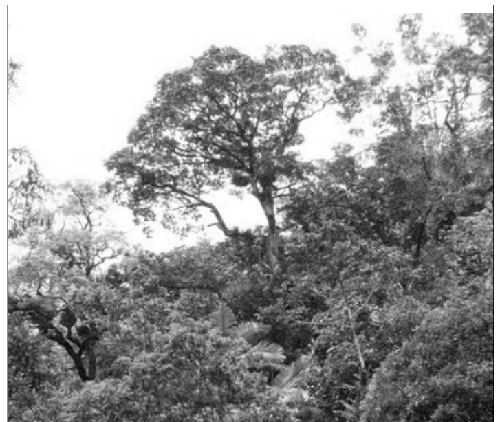
Der Regenwaldschutz in Afrika ist eine der „Baustellen“ des Vereins „Lernen-Helfen-Leben“