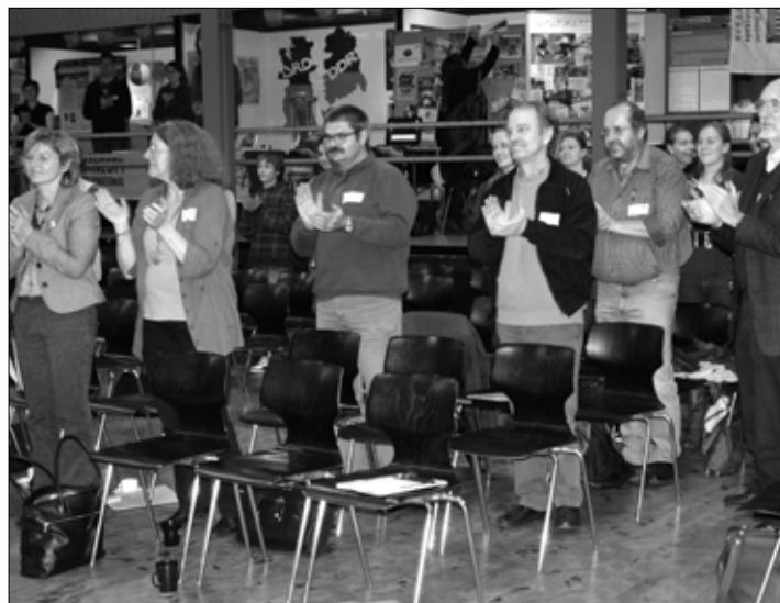
Auf der Fachtagung „Perspektivenwechsel. Wie Schule global lernt“