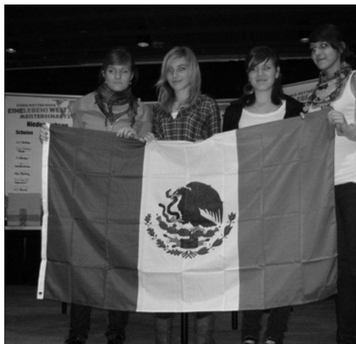
Das Fußballprojekt des VEN steht nun in den Startlöchern