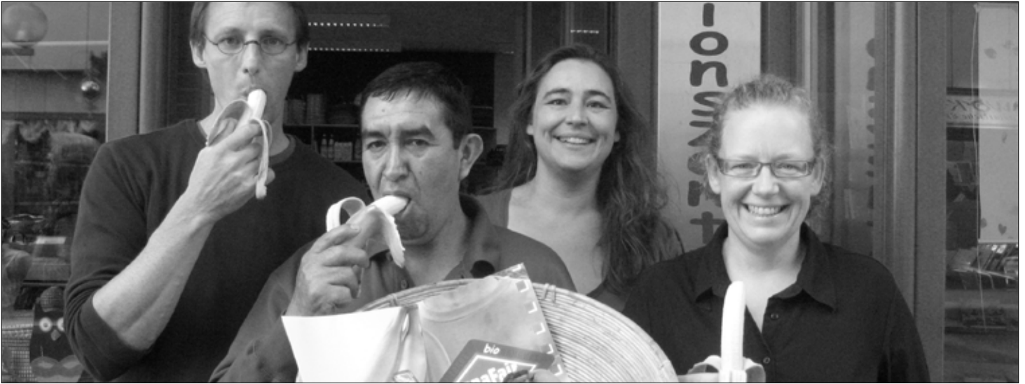
Das Team der Fairen Woche veranstaltete in Osnabrück vielfältige Aktionen