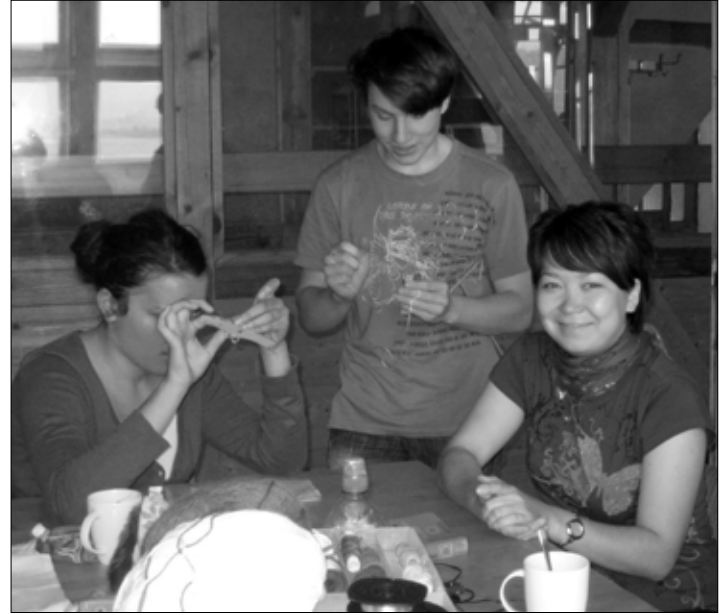
Der Weltwärts-Austausch sollte in beide Richtungen funktionieren