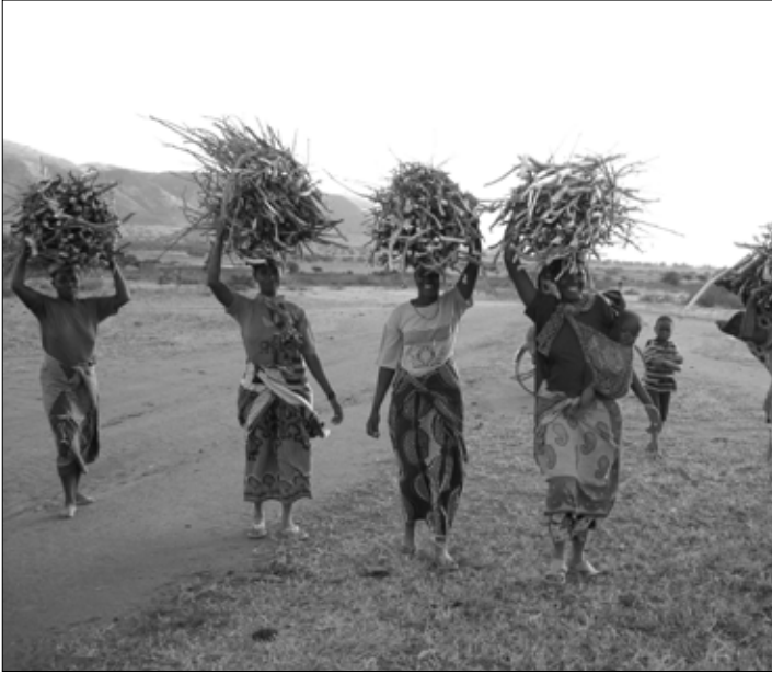
Das Land Niedersachsen plant eine neue Partnerschaft mit Tansania

Die Ausstellung versucht, Konsumgewohnheiten in Frage zu stellen und propagiert Alternativen. Sie fordert den freien und fairen Zugang zu frischem Wasser und zur Abwasserreinigung. Sie zeigt auf, wie politische Arbeit dazu aussieht und wie auch einzelne Solidaritätsprojekte helfen können.