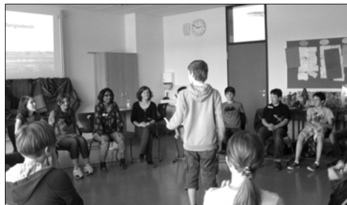
Workshop Eine Welt Tag