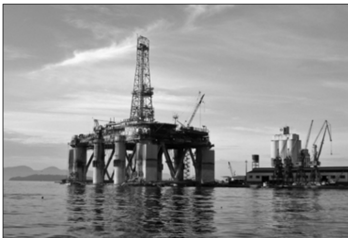
Wir sind Erdöl-Junkies geworden ...

Von manch Anderem darf man hingegen nicht zu wenig haben. Sauberes Trinkwasser benötigt jeder Mensch, laut der UNO mindestens 50 Liter am Tag zum trinken, kochen und waschen. Unser tatsächlicher Verbrauch steckt jedoch nicht nur in unseren sanitären Leitungssystemen, sondern ist immer auch in jedem Konsumprodukt enthalten, 10 Liter Wasser für ein DIN A4-Blatt Papier, 20.000 Liter für einen Computer, insgesamt konsumiert jeder Mensch in Deutschland täglich 4.230 Liter dieses „virtuellen“ Wassers ( www.virtuelles-wasser.de ).