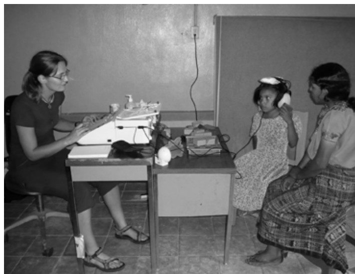
Bei dem Projekt „Orejitas Felices“ werden schwerhörigen Kindern Hörgeräte gestiftet.

Ein weiteres Projekt war 2008 der Bau einer Nachmittagschule in Guatemala in der Region Escuintla, die Kindern in abgelegenen Dörfern einen Schulbesuch ermöglicht, da die staatlichen Schulen so weit entfernt sind, dass die Kinder mehr als zwei Stunden Fußweg auf sich nehmen müssten.