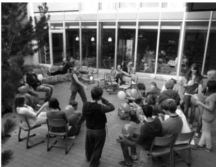
Eine 10. Klasse an der IGS Langenhagen klärt die Ursachen der Treibhausgasemission ( symbolisiert durch Luftballons)

Weitere Informationen gibt es bei JANUN | www.schoenerleben.janun.de | weltbewegend@janun.de | Tel: 0511 - 3945458