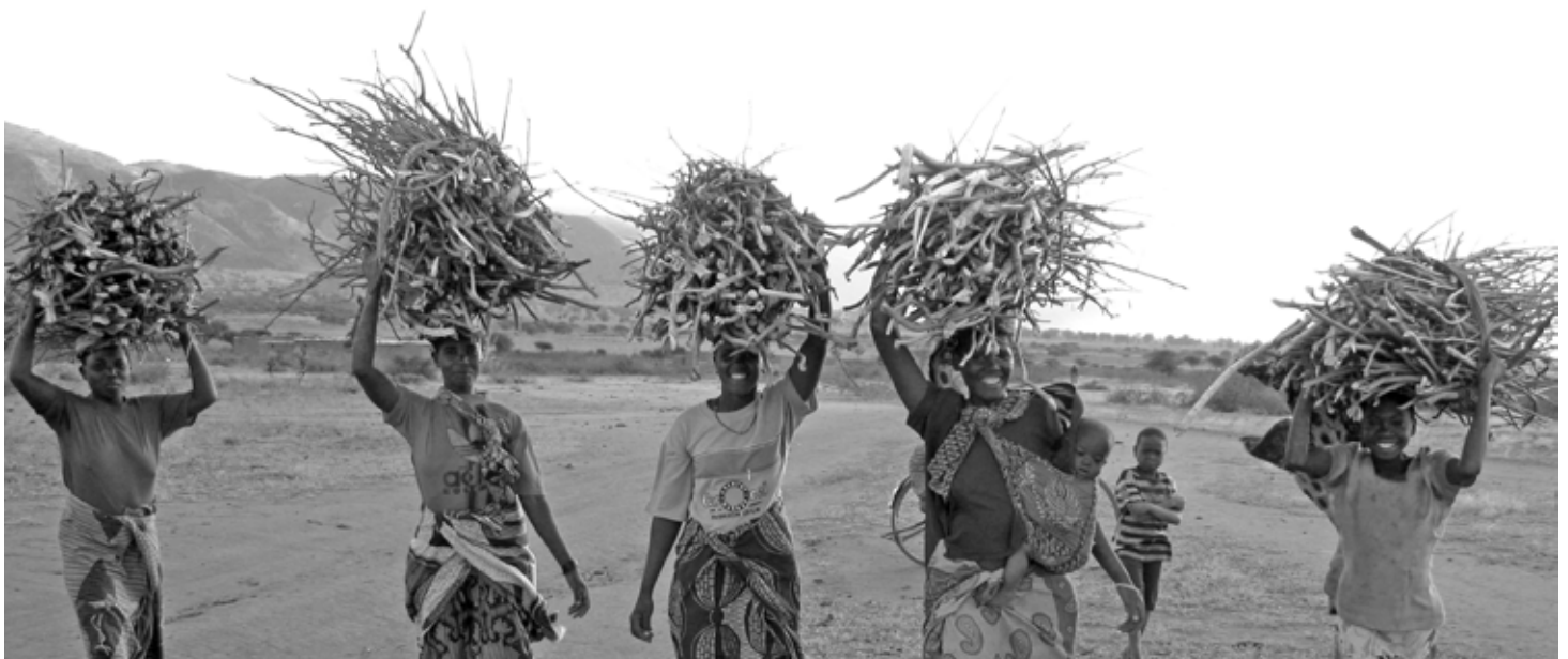
Von der Landnahme in Entwicklungsländern sind besonders die Kleinbauern betroffen.

Die Lotto-Sportstiftung legt großen Wert auf den Nachweis der Professionalität, Eignung und eigene Erfahrung des Antragstellers im Migrationsbereich. Nachhaltige und langfristige Arbeit sind wichtig, ebenso Kreativität und Innovation, Vernetzung wird vorausgesetzt, Gender Mainstreaming ist Bedingung. Zielsetzung, Zielgruppe und Inhalte müssen klar definiert sein. Näheres erklären die Förderschwerpunkte.