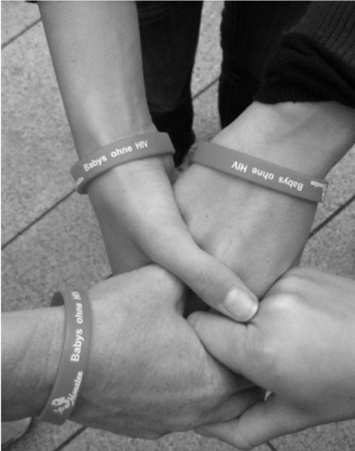
Rund 500 Menschen trugen rote Armbänder mit der Aufschrift „Babys ohne HIV“ im Kampf gegen HIV, insbesondere bei schwangeren Frauen

Mehr als 300 Menschen unterstützten vor und nach dem Konzert die deutschlandweite Unterschriftenaktion für das Recht auf HIV-Medikamente und gegen die Mutter-zu-Kind-Übertragungen von HIV. Vor der Kirche waren Stationen des Aktionsbündnisses aufgebaut, wo Unterschriften geleistet werden konnten. Große Fußabdrücke auf der Straße führten die Interessierten entlang der Geschichten betroffener Frauen aus Deutschland und aus Südafrika direkt zum Stand.