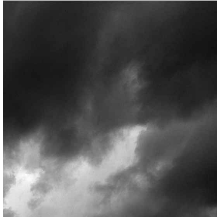
Bioenergien, die Klimakrise und der Hunger ...

Mit Hochdruck wurde in diesem Jahr an den Nachhaltigkeitsverordnungen Biomassestrom und Biokraftstoff gearbeitet, die bis 2010 umgesetzt werden soll und Grundlage der Zertifizierung wird. Bisher weisen die Nachhaltigkeitsverordnungen aber große Lücken auf. Weder die Ernährungssicherung noch Sozialstandards finden sich in den Verordnungen wieder. Ein weiteres Loch klafft bezüglich der indirekten Landnutzungsänderungen, die ebenfalls bisher nicht erfasst werden. Negative Treibhausgasbilanzen, die durch die Rodung von Urwäldern entstehen, werden nur dann einbezogen, wenn eine Energiepflanzenplantage direkt auf Urwaldgebiet angelegt wird. Werden die Plantagen auf alten Produktionsflächen oder Viehweiden angelegt und diese verdrängen dann den Urwald, so sind die Treibhausgasbilanzen nicht erfasst. Auf dieser Grundlage wird die Zertifizierung eine Mogelpackung. Der VEN fordert, diese Defizite offen zu legen und sich darauf zu konzentrieren, den eigenen Energiebedarf eben nicht mit Importen zu decken. NGO's aus dem Süden fordern zu Recht: Werdet ihr im Norden nachhaltig, das ist für uns gute Entwicklungspolitik!