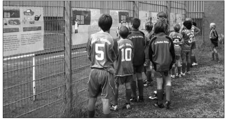
Aushang des VEN-Minibuch „Das neue Trikot“