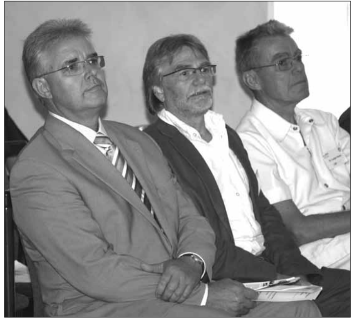
„Schönreden gilt nicht“ hieß es auf der Landtagsveranstaltung

Friedrich-Otto Ripke, Staatssekretär im Niedersächsischen Ministerium für Ernährung, Landwirtschaft, Verbraucherschutz und Landesentwicklung betonte in seinem Grußwort die Wichtigkeit und den Erfolg des VEN für Niedersachsen: Er gebe einer Stimme Gehör. Zugleich sagte er zu, die finanzielle Hilfe fortzusetzen. Einen Schwerpunkt und Ziel der niedersächsischen Entwicklungshilfe bildet dabei der ländliche Raum.