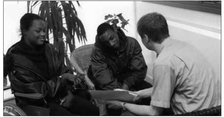
Behinderte mit Migrationshintergrund haben es meist doppelt schwer