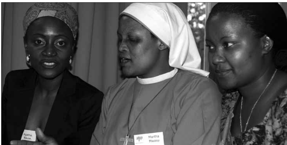
Vom Klimawandel betroffene Frauen aus Tansania und Bolivien berichten von ihrer Situation

Nur eine zukunftsfähige Klimapolitik, die Genderaspekte ausreichend berücksichtigt, wird die bereits heute dramatischen Auswirkungen des Klimawandels mildern können. Dies ist das wichtigste Ergebnis der vom VEN organisierten internationalen Konferenz im Stephansstift vom 25.- 26.08.2009, auf der diskutiert und reflektiert wurde, wie eine global und geschlechtergerechte Klimapolitik aussehen könnte und welche Rolle dabei Politiker, Kommunen, Verbände und Einzelpersonen übernehmen sollten.