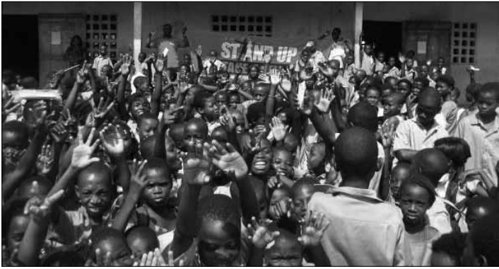
Stand up: Kinder in Togo stehen auf