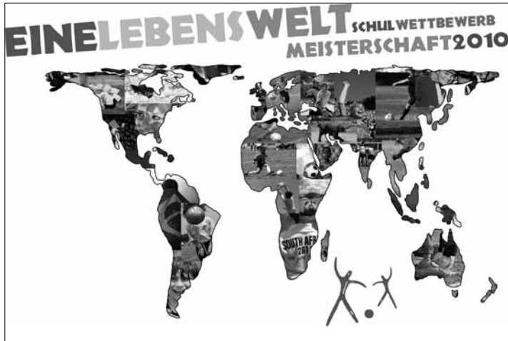
Das Plakat zum Wettbewerb