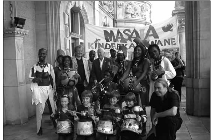
Pressetermin des Akoma Pa-Teams vorm Rathaus