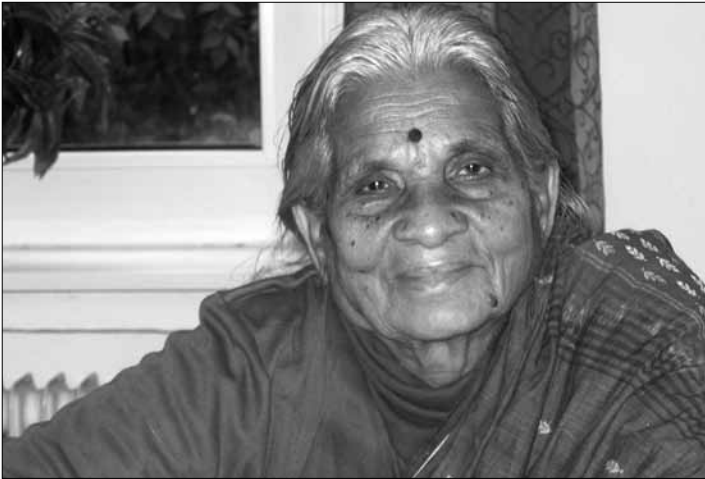
Krishnammal Jagannathan, Trägerin des alternativen Friedensnobelpreises 2008