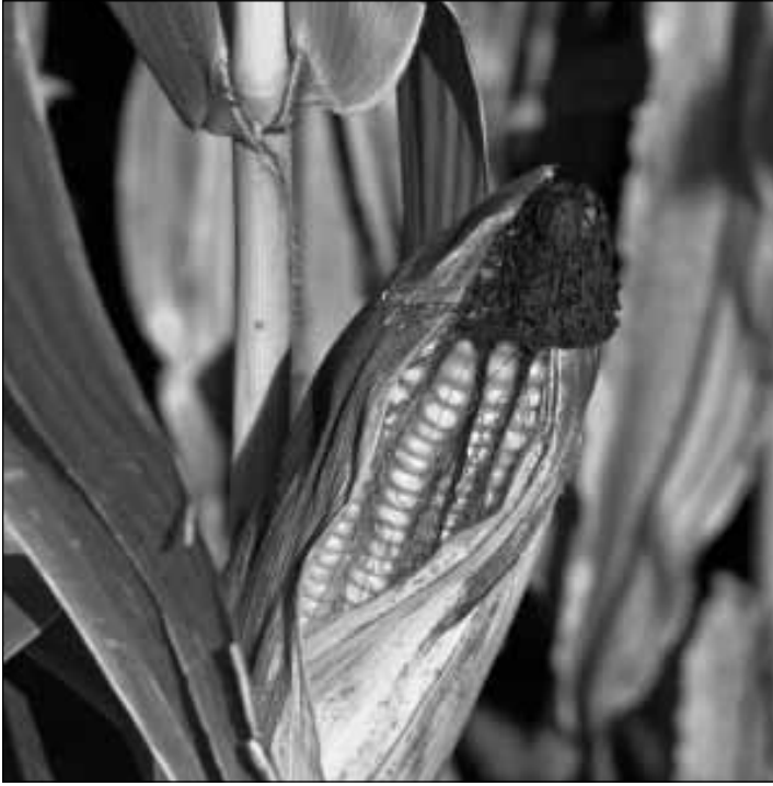
Gentechnik bei Energiepflanzen ist ein höchst kontroverses Thema