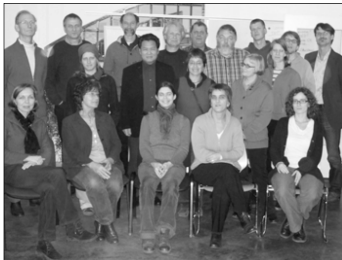
Weltoffen – Der Verbund WELTOFFEN

„Im Verbund ist man stärker“, so der Tenor der 23 Vertreter von Organisationen, die bundesweit als Entsendeorganisationen am Freiwilligenprogramm WELTWÄRTS teilnehmen oder mitdiskutieren wollen. So gründeten sie am 16.1. in Berlin den Verbund WELTOFFEN. Der programmatische Name besagt schon, dass der Zusammenschluss nicht auf konfessionelle Grenzen achtet, denn die Kirchen sind entlang alter Grenzen und Gebräuche (cuius regio, eius religio) nicht zu einem gemeinsamen Verbund bereit gewesen. Den Bereich der evangelischen Kirche vertritt eFeF ( www.efef-weltwaerts.de ), den der katholische Kirche die fid ( www.agede/fid/fid_freiwilligendienste_M.htm ).