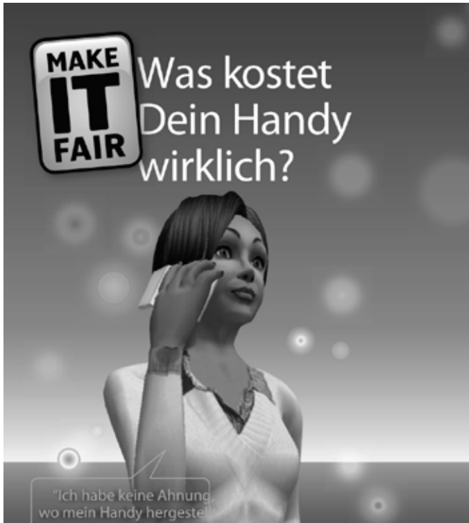
Ausschnitt aus einem Plakat des Projektes makeITfair (Download: www.makeitfair.org )

um dort zur Armutsbekämpfung und wirtschaftlichen Entwicklung beizutragen“, erklärte die Ministerin.