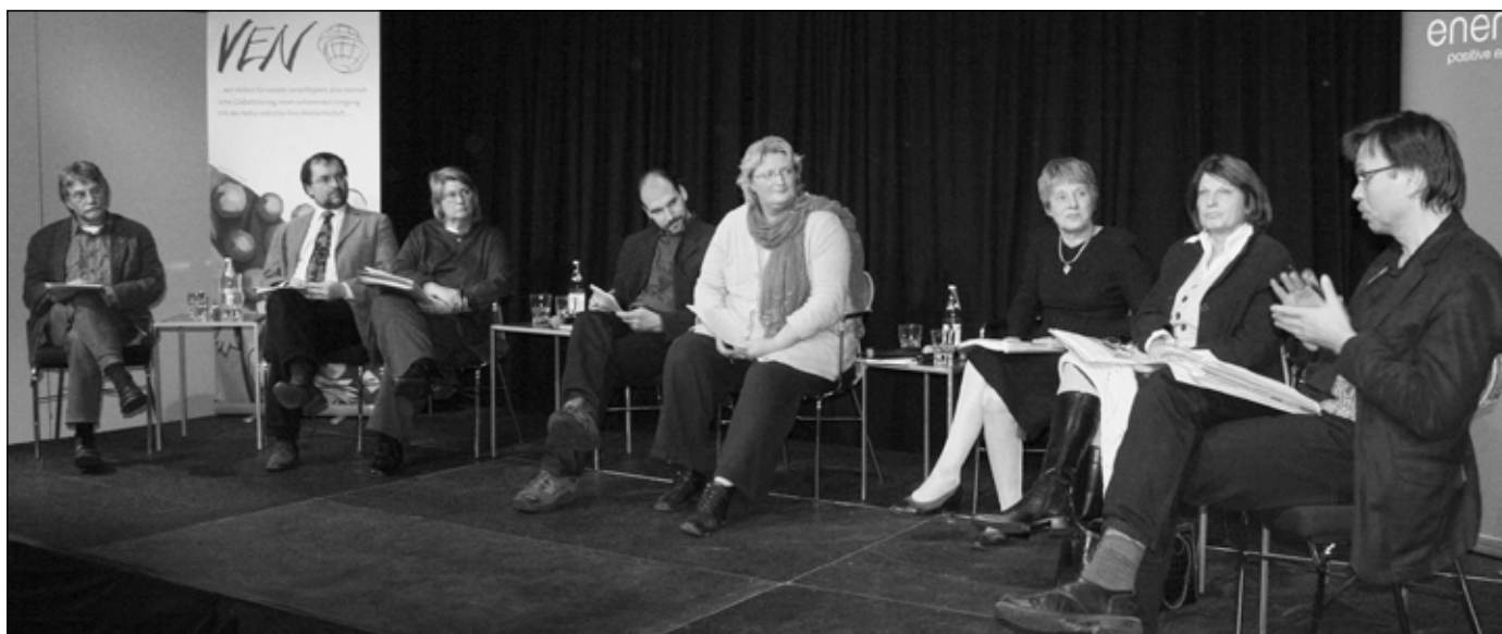
Angeregter Meinungs austausch zum Thema „Beschaffung der öffentlichen Hand“ bei der Podiumsdiskussion „Fairness in Niedersachsen?“