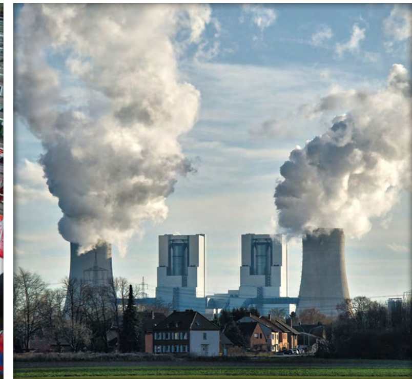
RWE-Braunkohlekraftwerk in Neurath (NRW); zu 25 % in kommunalem Besitz