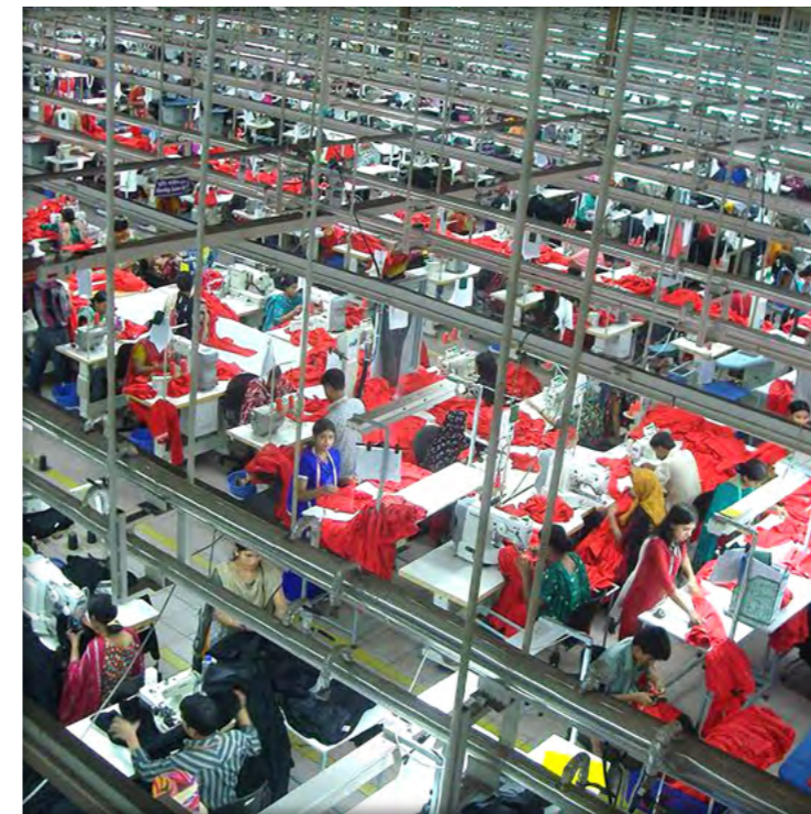
Textilfabrik in Bangladesch; Länder beschaffen u. a. Textilien für Polizei und Feuerwehr.

Diese Verantwortung von Unternehmen bezieht sich nicht nur auf die menschenrechtlichen Auswirkungen ihrer eigenen Aktivitäten, sondern auch auf Auswirkungen, die direkt mit Operationen, Gütern und Dienstleistungen in ihren Geschäftsbeziehungen entlang der Wertschöpfungskette verbunden sind, auch wenn die Unternehmen selbst zu diesen Auswirkungen nicht beigetragen haben.