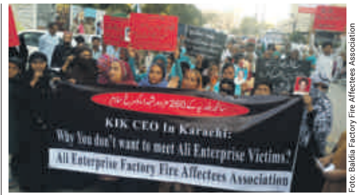
Betroffene des Fabrikbrandes bei Kik-Zulieferer in Pakistan demonstrieren für Gerechtigkeit.