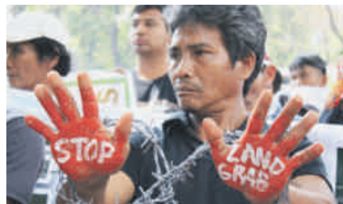
Protestaktion gegen Landgrabbing in den Philippinen