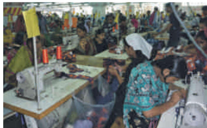
Textilnäher*innen in Bangladesch