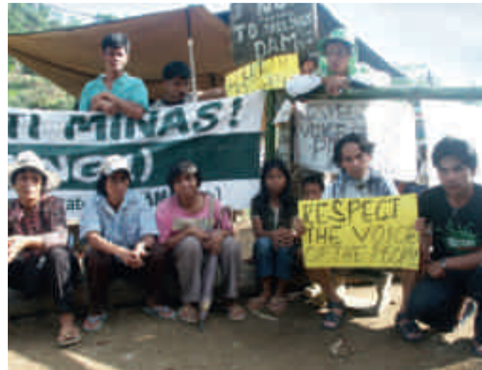
Indigene protestieren gegen die Didipio Goldmine des australischen Bergbaukonzerns Oceana Gold in den Philippinen.

Als Ecuador und Südafrika 2014 einen neuen Anlauf unternahmen, im UN-Menschenrechtsrat ein verbindliches Abkommen auszuhandeln, machte die Wirtschaft mobil. Doch aller Lobbyarbeit zum Trotz wurde die Einrichtung einer zwischenstaatlichen Arbeitsgruppe zur Erstellung des Abkommens beschlossen. Daraufhin machten die Wirtschaftsverbände eine taktische Kehrtwende. Sie kündigten an, sich an den Diskussionen in der Arbeitsgruppe zu beteiligen. Wenn sich Wirtschaft und Industrieländer heraushielten, so die Befürchtung, könnte sich