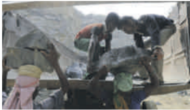
Ausbeuterische Kinderarbeit in einem indischen Steinwerk

werden weltweit durch Monokulturen, Bergbau, Stahlwerke und Fabrikanlagen verwüstet. Giftige Abwässer aus Minen und der industriellen Land-